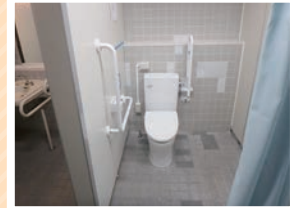
完成。ナイスコールも増設し、安全対策も万全です。