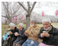
十王バラマ公園でお花見