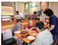
ファミリーレストランにて

本宮町クラブでは定期的に外出レクリエーションを行っています。新型コロナも5類に移行しましたが、感染対策をしっかりと行い、市内の公園やドライブ、外食を行っております。また、市外への長距離外出も行っており市外に行く機会の少ない利用者様たちもいつもと違った風景等を楽しんで頂いております。